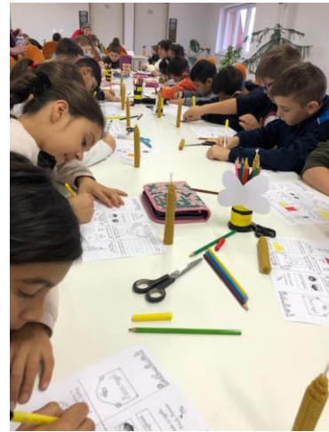
A felső tagozatosok méhecske ceruzatartót készítettek ezen az állomáson: