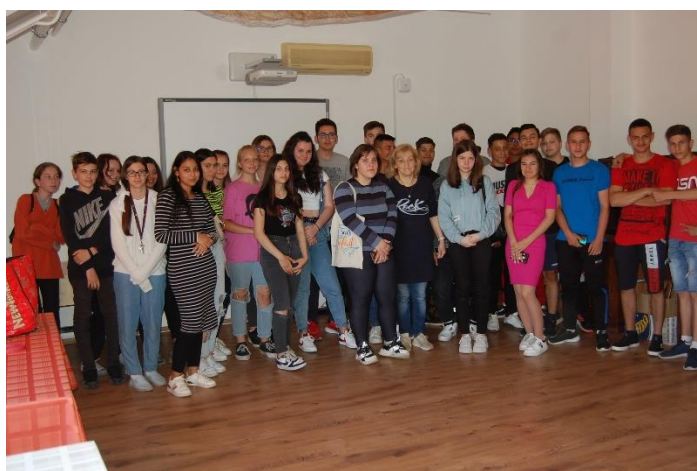
1. program elem: Gyulavarsand- Arad- - Csernakeresztúr